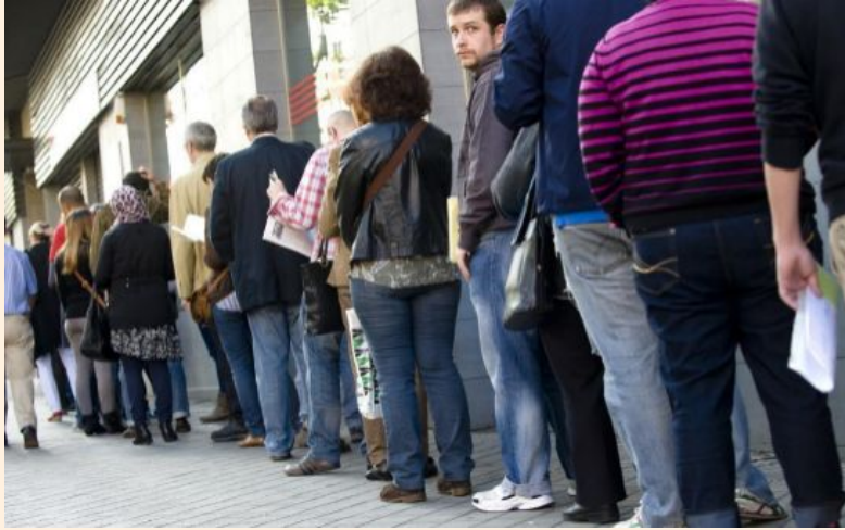
Cola del paro en una oficina de empleo en la comunidad de Madrid.

España alcanzó las 2,39 millones de personas al término de 2016. La cifra descendió en 453.200 parados con respecto a 2015.